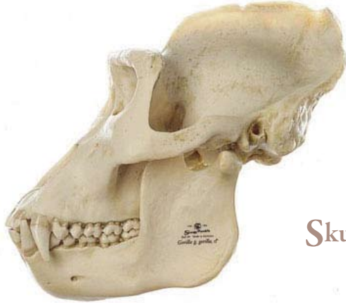
SZoS50 Skull of Gorilla

Gorilla g. gorilla (Savage a. Wyman 1847), male, made in SOMSO-Plast®. Natural cast. Lower jaw movable and can be removed.