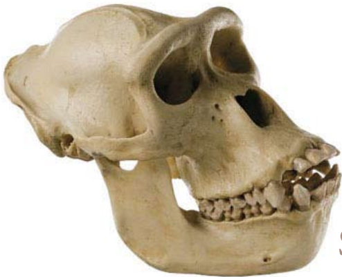
SZoS50 Skull of Gorilla

Gorilla g. gorilla (Savage a. Wyman 1847), female, natural cast, made in SOMSO-Plast®. Lower jaw movable and can be removed.