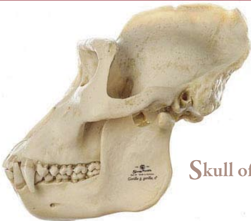
SZoS50S1 Skull of Young Gorilla

Gorilla g. gorilla (Savage a. Wyman 1847), male, (1 1/2 years old). natural cast, made in SOMSO-Plast®. Lower jaw movable and can be removed.