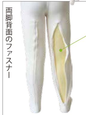
両脚背面のファスナー