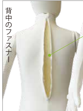
背中のファスナー