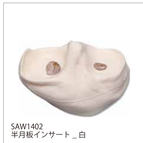
SAW1402 半月板インサート_白

別売りオプションとして、膝関節を専門とする整形外科医師のために複数の病態が再現された半月板が用意されています。これらの半月板に交換することで多彩な膝関節鏡視下手術シミュレーションの実施と技術習得が可能になります。