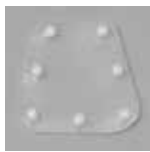
SAW1485-42 外側透明ポータルカバー