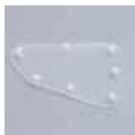
SAW1485-41 後方透明ポータルカバー