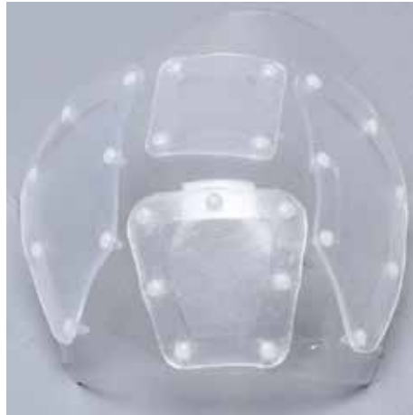
SAW1485-62 ポータルカバー付き透明肩キャップ 交換部品 SAW1410-4-13 アレックスⅢ用