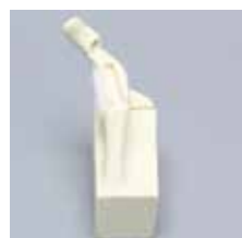
SAW1050-36 関節窩なし肩甲骨