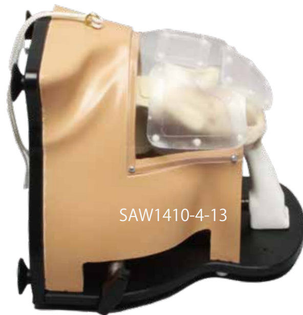
Alex III shoulder

以下の関節窩、骨頭、ローテーターカフが各1個含まれています。関節窩、上腕骨骨頭には異なるタイプの別売り交換品も用意されています。