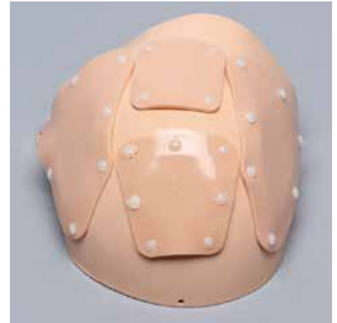
SAW1485-36 ポータルカバー付き肌色肩キャップ 別売りオプション アレックスⅡ・アレックスⅢ用