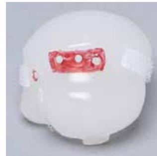
SAW1051-28 アンカー用穴付き上腕骨骨頭

Material: Solid Foam Includes reinforced semi-flexible partial cuff.