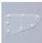
SAW1485-40 前方透明ポータルカバー