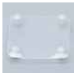
SAW1485-43 上側透明ポータルカバー