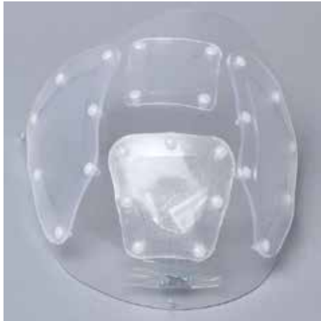
SAW1485-35 ポータルカバー付き透明肩キャップ 交換部品 SAW1410-4-15 アレックスⅡ用交換部品