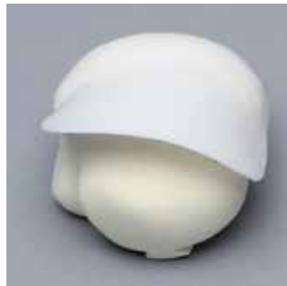
SAW1051-29 腱板の一部付き上腕骨骨頭

Material: Solid Foam Includes reinforced semi-flexible partial cuff.